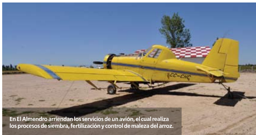
En El Almendro arriendan los servicios de un avión, el cual realiza los procesos de siembra, fertilización y control de maleza del arroz.