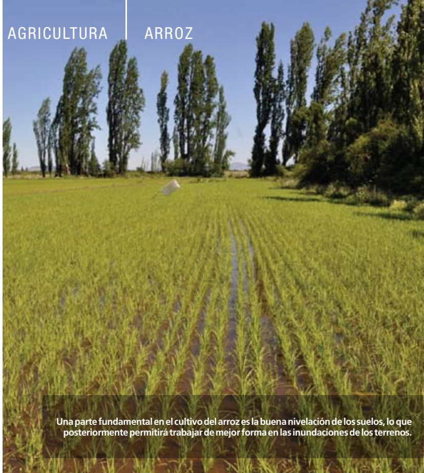
Una parte fundamental en el cultivo del arroz es la buena nivelación de los suelos, lo que posteriormente permitirá trabajar de mejor forma en las inundaciones de los terrenos.

inscrito y al que se extrae de los pozos y tranques.