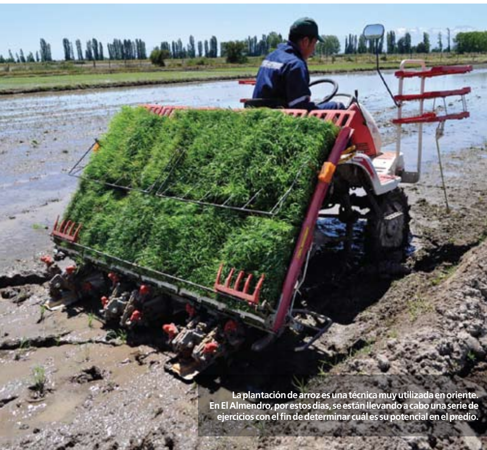
La plantación de arroz es una técnica muy utilizada en oriente. En El Almendro, por estos días, se están llevando a cabo una serie de ejercicios con el fin de determinar cuál es su potencial en el predio.

Entre las labores más específicas que se desarrollan en El Almendro, destacan varias, como el control de malezas, la fertilización y la siembra, las cuales se realizan a través de la utilización de