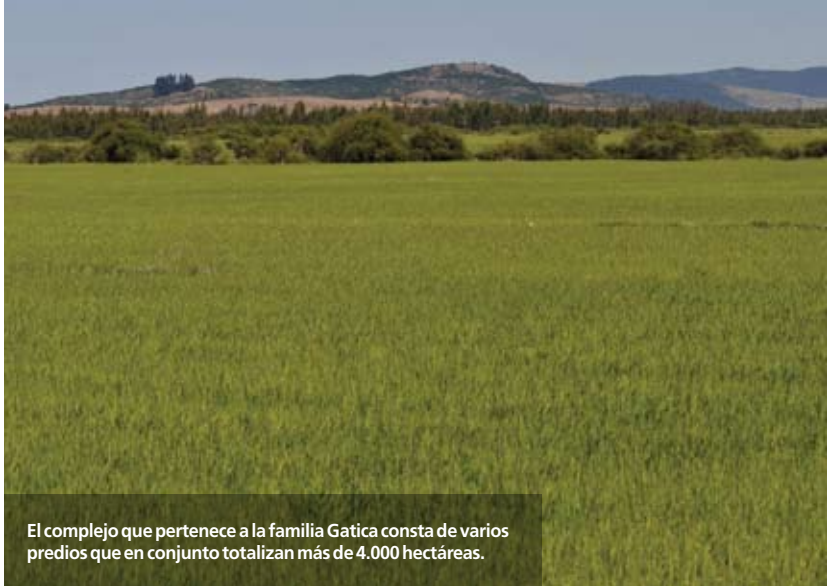
El complejo que pertenece a la familia Gatica consta de varios predios que en conjunto totalizan más de 4.000 hectáreas.

un avión, cuyo rendimiento le permite abarcar la nada despreciable cifra de entre 100 y 150 hectáreas por día. “Esto, claramente, nos da eficiencia y uniformidad”, precisa Carlos Cisternas.