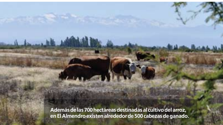
Además de las 700 hectáreas destinadas al cultivo del arroz, en El Almendro existen alrededor de 500 cabezas de ganado.